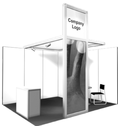
Image avec 2 côtés ouverts

Le stand système Wall est une solution de haute qualité vous permettant de mettre en scène vos produits et votre entreprise à ineltec. Avec ce package de stand, vous pouvez aussi vous présenter de manière optimale et à moindres coûts.