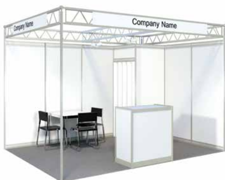
Image avec 2 côtés ouverts

Le stand système Beta contient tout ce dont vous avez besoin pour votre participation au salon, et à des conditions très attrayantes. Vous pouvez concevoir votre participation à ineltec de manière optimale et à moindres coûts.