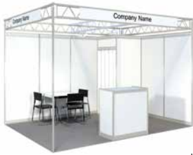
Image avec 2 côtés ouverts