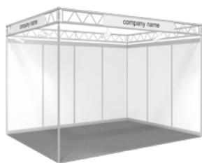
Image avec 2 côtés ouverts